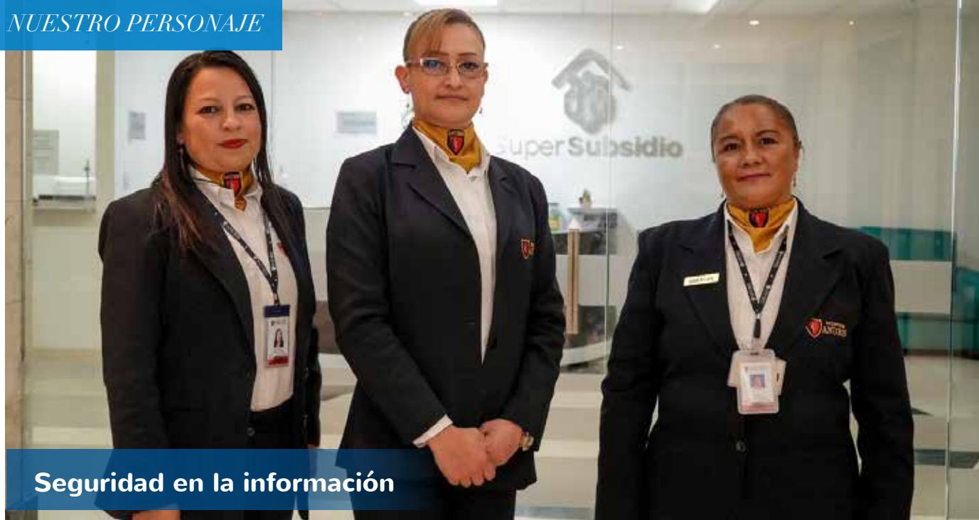
Seguridad en la información